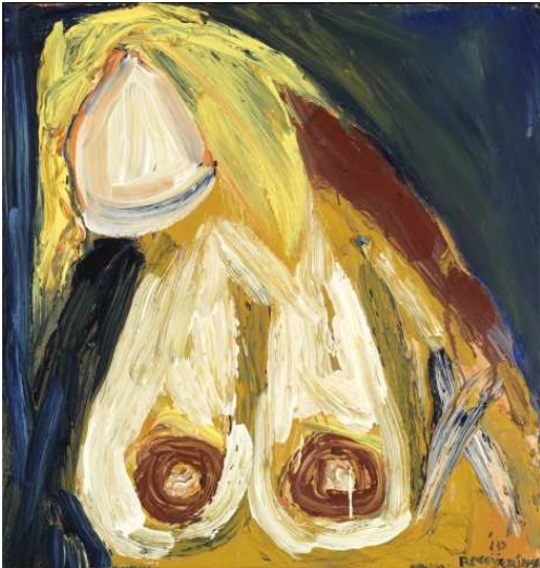
Ralph Meijeringh, Naakt met wit gezicht acrylverf op doek, 50 x 50 cm.