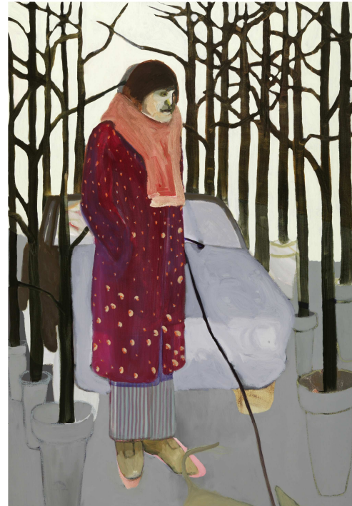
Astrid Oudheusden, Bad company olieverf op doek, 135 x 95 cm.