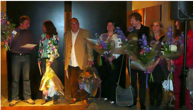
winnaars en eervolle vermeldingen van de Beeldend Gesproken Kunstprijs 2011